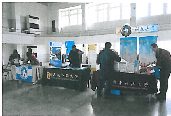
依照各校申請作禮堂攤位安排