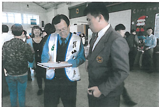
各學校熱情招呼學生