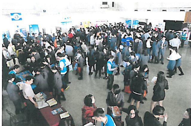
學生自由參觀各學校校系