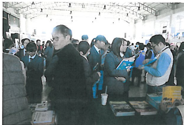
針對理想校系提出問題