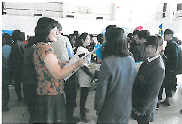
教授回答學生對校系的問題