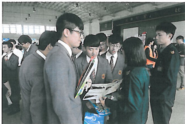
學生詢問軍校相關資訊