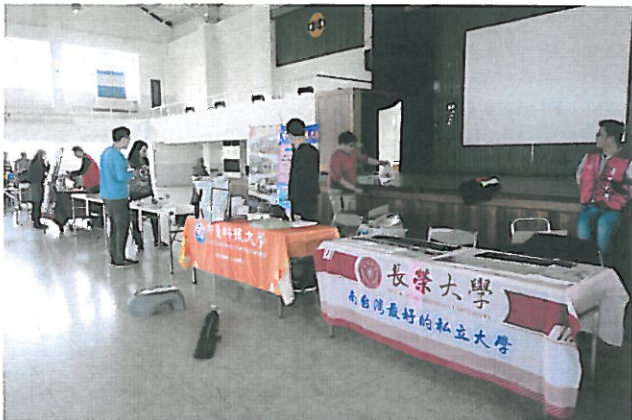
各大學校系準備中