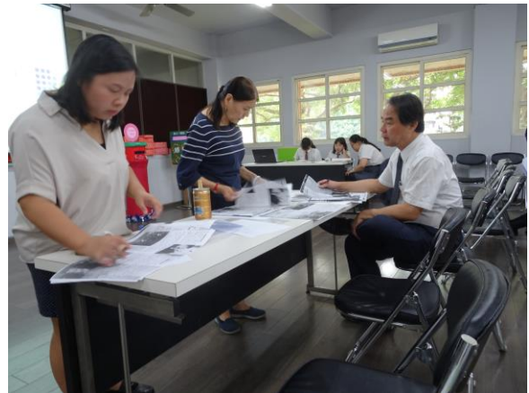
評審老師說明競賽規則