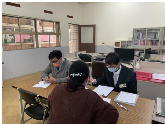
規劃重大議題融入課程