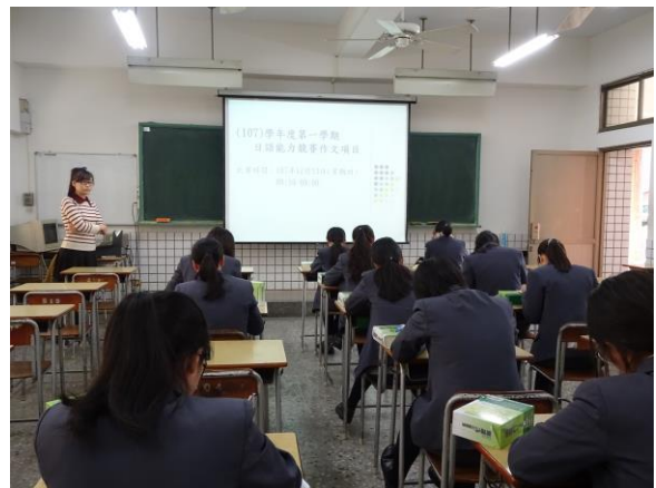
參賽對象為應日科二、三年級學生