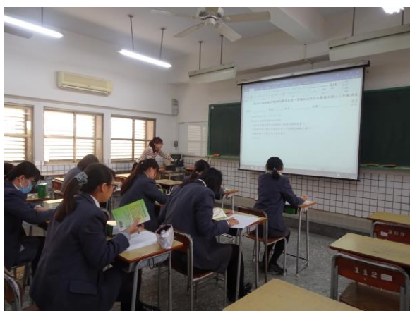
提供抽籤後題目內容大意給學生看