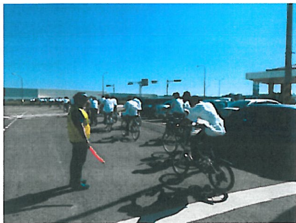
4. 環保之旅開往下一個目的