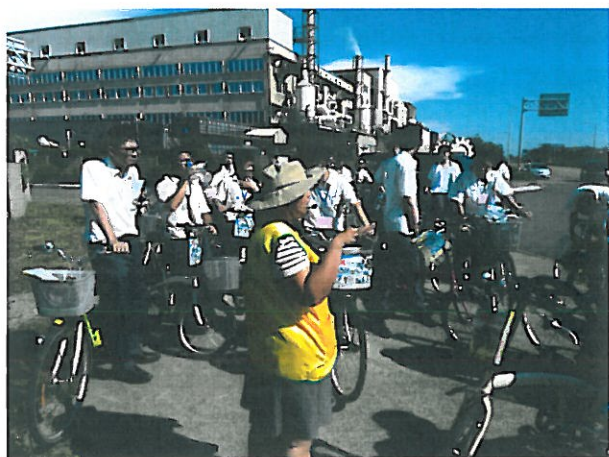
2.說明工業區廢水的處理方式