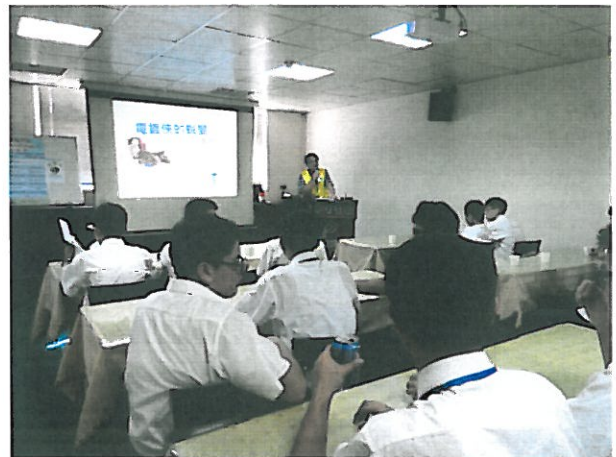
2.講解電鍍的昔今的技術方法