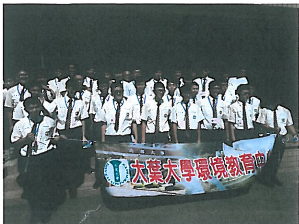
1.參與大葉大學環境教育研習