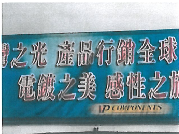
1.介紹電鍍廠的運作處理方式