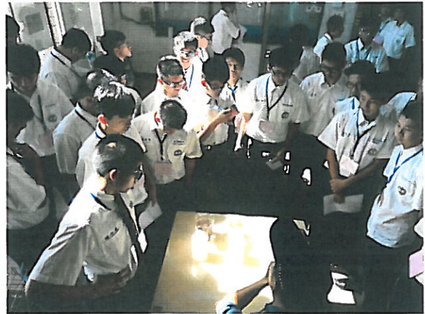
4.污水廠人員解說廢水的處理情形