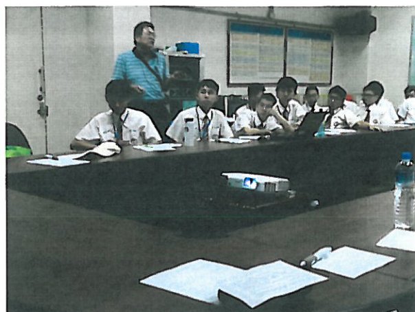
4.Lego 機器人四個傳感器的介紹