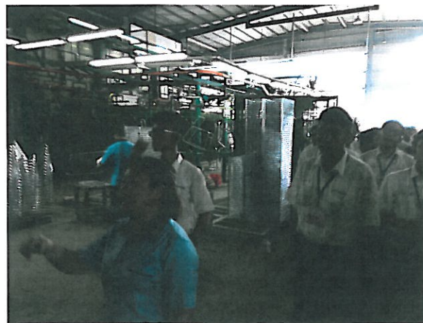
6 參觀電鍍工廠，解說員解說