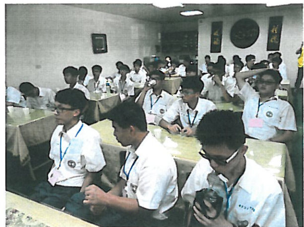
6 解說廢水的處理方法