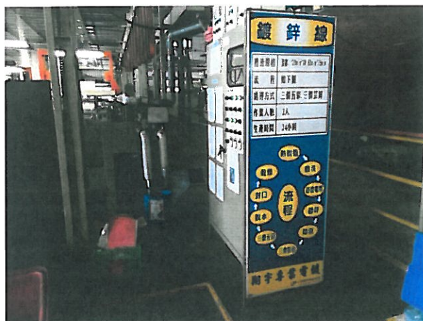
5. 介紹電鍍廠的電鍍處理過程