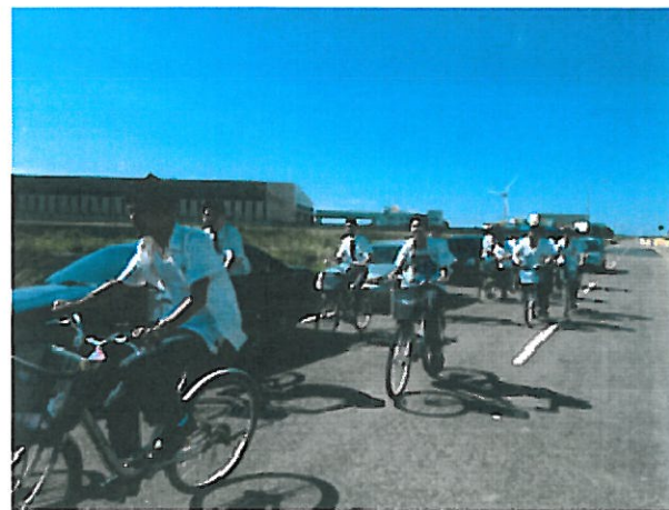
5 環保之旅-騎自行車中