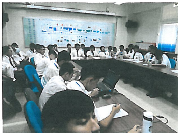
2. Lego 機器人介紹