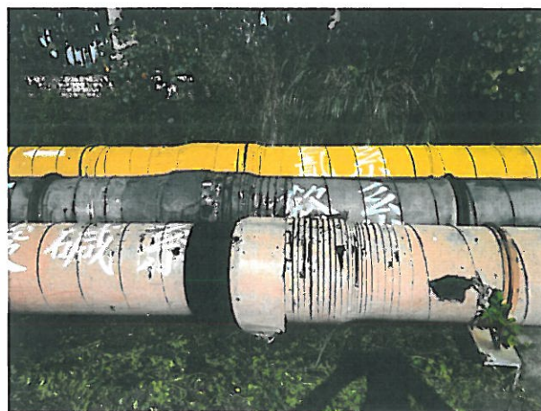
3. 電鍍廢水的專用管線