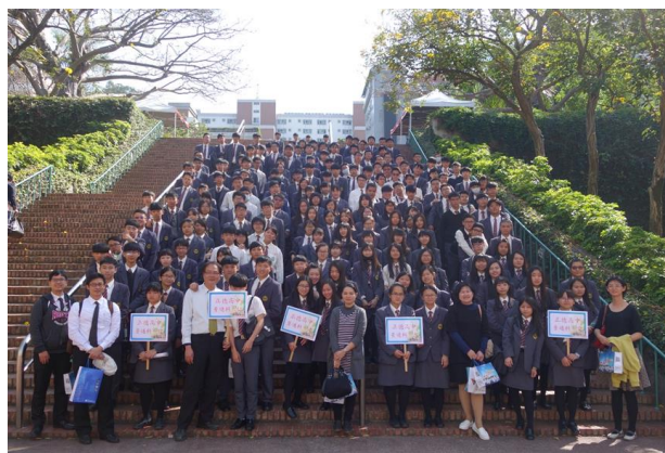
(朝陽科技大學校系參訪)

對高中部學生而言，大學校系參訪對未來在選擇學校及科系時，提供一個很重要的參考。每年輔導室都會針對高二及高三的同學辦理不同的大學及科技校院參訪。本學期於3月23日辦理，高中部二年級的學生至亞洲大學及朝陽科技大學參訪，在兩校大學部學生帶領之下，進行校園參觀及各學系的探索。過程中除了直接和大學生接觸、互動，還到不同的系所參觀，提早讓同學們體會大學生活的真實情境，也瞭解各個不同科系的教學重點。透過這次參訪，相信同學們對自己的未來生涯規劃會有更清楚的方向。