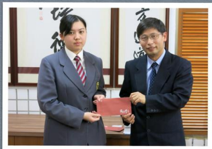
應日三孝涂競之同學通過日本語能力試驗N1級檢定，殊為不易，校長特予鼓勵合影留念20180313