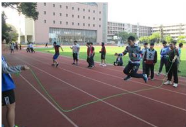
(參賽者認真參與跳繩比賽)