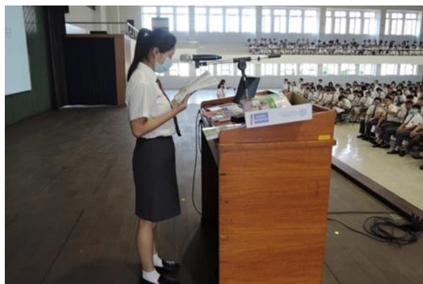
(高中部同學表現優異，贏得全場掌聲)

每月舉行的週會對同學們來說是既緊張又刺激，因為在校長勉勵完同學之後，就會由教務主任主持英語課文抽背。看到很多同學帶著課本進入禮堂，就知道同學們非常在意這個活動。雖然，每個年級只抽出一位同學，但大家都嚴正以待，因為對同學而言，上台面對一千多位同學唸英文，可說是一件充滿挑戰性的事。