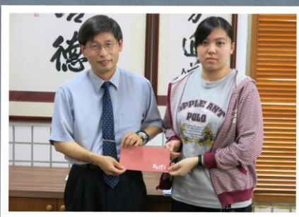
應日三孝涂競之同學(106)第三次校外模擬考試， 成績優異，校長特予鼓勵並合影留念20180329