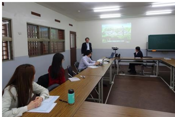
(教務主任介紹電影的劇情及觀看感想)

為了充實教學設備及研發學校本位的特色課程，本校參與教育部主辦的高中優質化計畫。在每週二的核心小組會議中，由各個子計畫的負責老師報告課程研發進度。3月6日由教務主任進行報告，他分享觀看電影「老師，你會不會回來」的心得，並期望老師們不但不會放棄學習落後的同學，還會改變自己的教學方式，提升同學們的學習動機。