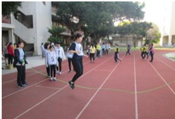
(跳繩比賽考驗全隊的默契)