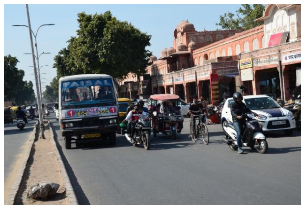
(印度的街頭：各式車輛彼此搶道)

其實，印度是一個有活力的國家，到處都是年輕人，各種攤販、門市交易，從早到晚絡繹不絕。貧窮人口很多，但有錢人富裕程度也相當嚇人，追逐金錢可算是大家共識，雖然具有資本主義精神，但背後傳統文化的深沉力量處處可見。例如穿著傳統服飾的女孩仍是逛街主流，在公園等景點常見扶老攜幼全家出遊的景象，廟宇的祭拜依然盛行，最為奇特的是印度人的隨意小便與吐痰，前現代的生活混雜在今日街道、商場與百貨公司、車站、公園中，讓人感受到相當特殊：一種被固著在傳統中的現代社會。