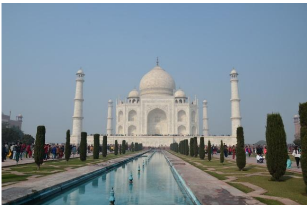
(世界遺產之一：泰姬瑪哈陵)