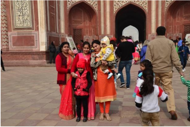
(著傳統服飾購物的印度婦女)

然而，這次旅行最令我印象深刻的是巨大城堡建築，泰姬瑪哈陵固不待言，亞格拉城堡(Agra Fort)令我感到震撼，琥珀堡(Amer Fort)更打開我對印度文明的新視角，而最令人難忘的就是住進塔爾沙漠邊緣的賈沙梅爾城堡(Jaisalmer Fort)。在新德里，我們也參觀了著名的紅堡(Red Fort)，先前只有在教科書讀到的資料或看到的照片，實地在現場體驗，才能真實感受到歷史或文明的力量。作為一位地理教師，行遍天下，體會真實的地理情境，真的有其必要性！而這次的印度之旅，引發我對世界文化與歷史的新興趣。