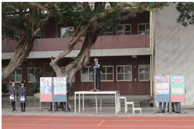
(校長主持開學典禮)

(106)學年度第二學期開學典禮中，校長透過分享寒假期間至印度教育交流的見聞，勉勵全校師生善用時間、把握現在，進而創造個人競爭力。而當日為悼念 2 月 6 日花蓮地震罹難同胞，本校國旗以降半旗方式誌哀。