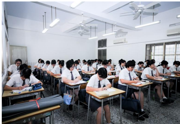
(妥適準備晨讀是一天學習成功的基礎)

「晨讀」顧名思義，就是希望用短短 30 分鐘沉澱自己的心境，開展一天的學習。時間很短但意義重大，預習今天的課業，完成未完成的作業，配合規劃進行考試，甚至作筆記以思考這一天的活動都是很好的方式，當然吃早餐也很重要(總不能在餓肚子的狀況下學習)，如果昨天沒睡好，就補一下眠，看起來似乎也是正當。不過校長還是要提醒大家：「好的開始是成功的一半」，如何讓一天的開始就有學習的 feel (感覺)是很重要的，把一大早美好時光放在吃早餐與補眠似乎不是很好的選擇，所以校長建議最好在家中就把早餐吃完，當然這需考慮時間，包含早起與父母親的配合，若無法做到，也應該利用最短時間在晨讀開始前把早餐吃完。但我觀察到許多同學們一到學校就先聊天，等到鐘聲響起才想到要吃早餐，這就是一種忙亂，在此種心境下，吃早餐就不是享受，讓自己生活陷入不確定的狀況，就不是一種好的開始，這當然包括補眠。