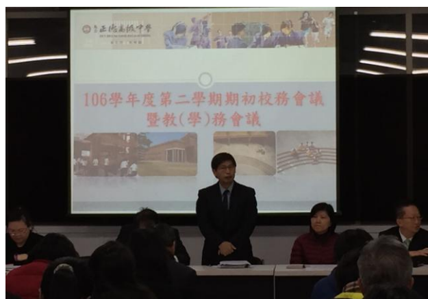
(校長主持期初校務會議)

(106)學年度第二學期「期初校務會議」中，校長首先期勉同仁能深入思考，如何面對接下來開學後的各項工作，因為這些都與學生學習息息相關。接著特別提到他這次寒假旅遊印度的經驗，在旅途間，見到當地學生成群穿著學校制服，他們筆挺的服儀令人十分讚賞——校長藉此特別重申本校應落實對學生穿著制服的要求，維護優良傳統，同仁除應持續貫徹，更要引以為榮。校長也針對各處室主任報告要點，作一總結，並語重心長地呼籲全體同仁務必配合各處室規劃的事項，而且更要全力動員，執行本學期招生工作，此舉不但是幫忙學校也是幫忙自己，大家共同努力，來面對這一極其嚴苛的挑戰。