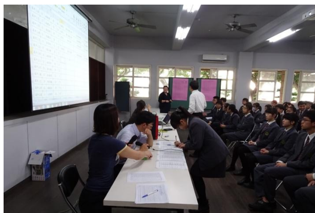
(同學認真挑選自己要報名的校系)