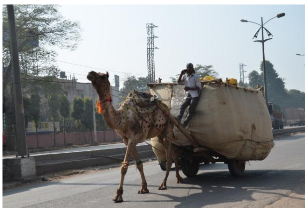
(傳統與現代：駱駝車上打手機)

在 8 個小時的航程後，第一次踏上印度次大陸是在晚上 6 點多(當地時間)，天色仍然明亮，但德里機場卻籠罩在一片迷霧中。搭上事先租賃的小客車，就直奔亞格拉(Agra)，這個以泰姬瑪哈陵聞名的城市。一路上見識到印度街道的紊亂，機車、腳踏車、三輪車、汽車、牛車、嘟嘟車相互搶道，二線道變成六線道，橫衝直撞，直到大家都塞在一起，動彈不得時，就以喇叭聲彼此抗議。我對印度城市的第一印象就是這種喧囂景象。