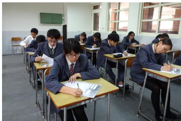
(參賽同學認真思考作文內容)