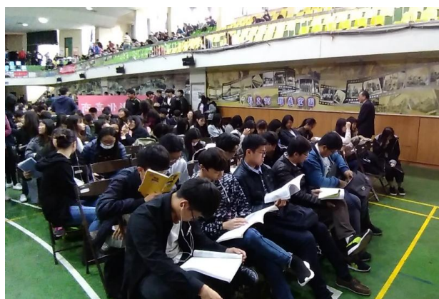
(同學全神貫注地作考前衝刺)

本校高中(職)部共 345 位學生參與(107)學年度大學學科能力測驗。為讓學生專心應試，考試期間高中部各班導師皆全程陪伴，施以適時照顧並解答疑問，服務隊隊員則為考生提供午餐餐盒準備、考場秩序與整潔維持等服務。校長、副校長、各處室主任與任課教師亦至現場為所有同學加油打氣，期勉同學努力奮鬥。