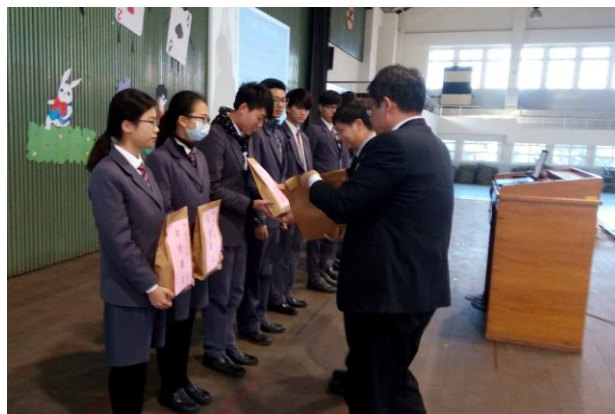
(各班代表自校長手中接下祝福)

大學學科能力測驗是對高中生三年來學習成果的檢驗，每年輔導室都會在考前聯合其他處室為學生舉辦祈福活動。今年當然也不例外！不免俗的在活動進行前，由校長、教務主任帶著學生的名單及本校為學生所準備的 2B 鉛筆與糖果到寺廟為學生們祈福，再來透過輔導室聯合各班導師所製作的簡短祝福之語，給予加油、鼓勵及溫馨的提醒，希望可以帶給考生穩定及安心的感受，讓他們能在考試時發揮出最大的實力。最後，整個活動就在各班代表上台從校長的手中接下了滿滿的祝福後，溫馨圓滿的結束。