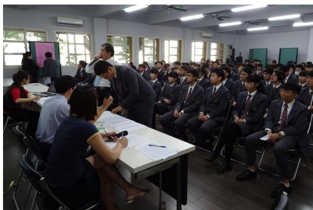
(教務主任播報同學選填的志願)

(107)學年度大學學測成績在 2 月 23 日公布，本校高中部同學表現相當優異。同學們在 3 月 2 日集合進行繁星撕榜，從校內學業成績排名前 1% 者為第一順位，開始選填志願，整個撕榜作業進行 1 個多小時，同學們選填了國立台灣大學、國立政治大學、國立高雄大學、高雄醫學大學、台北醫學大學、中國醫藥大學、中山醫學大學等名校。全校共有 92 位同學參加繁星撕榜，就同學們今年的優異成績看來，相信錄取的人數會超越往年。