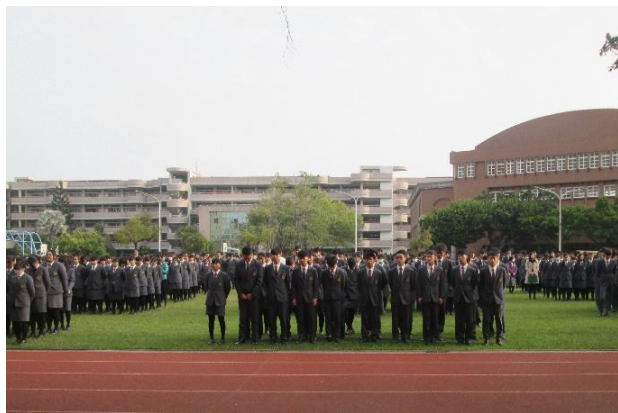
(同學專心聆聽訓導)