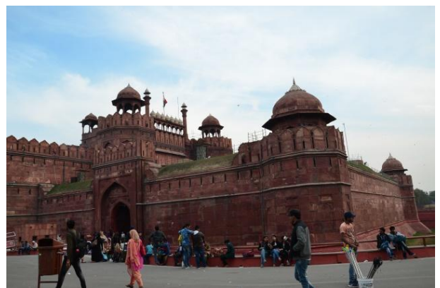
(世界遺產之一：德里紅堡)