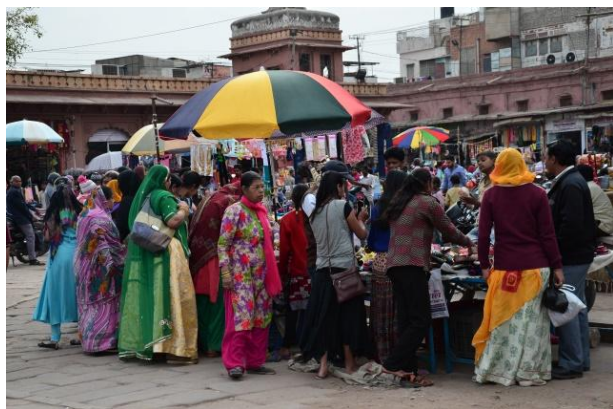
(著傳統服飾購物的印度婦女)

其實，印度是一個有活力的國家，到處都是年輕人，各種攤販、門市交易，從早到晚絡繹不絕。貧窮人口很多，但有錢人富裕程度也相當嚇人，追逐金錢可算是大家共識，雖然具有資本主義精神，但背後傳統文化的深沉力量處處可見。例如穿著傳統服飾的女孩仍是逛街主流，在公園等景點常見扶老攜幼全家出遊的景象，廟宇的祭拜依然盛行，最為奇特的是印度人的隨意小便與吐痰，前現代的生活混雜在今日街道、商場與百貨公司、車站、公園中，讓人感受到相當特殊：一種被固著在傳統中的現代社會。