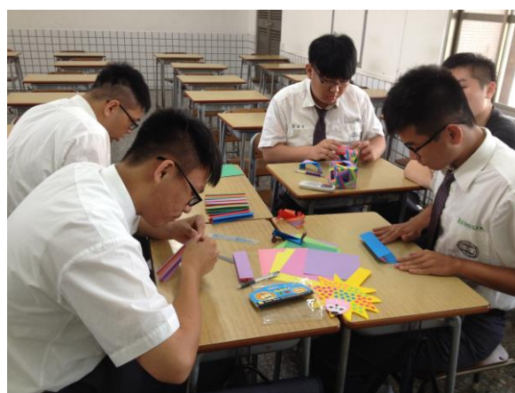
學生陸續完成摺紙