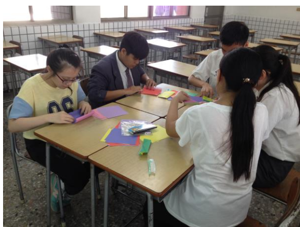
摺紙教學-鏤空正六面體