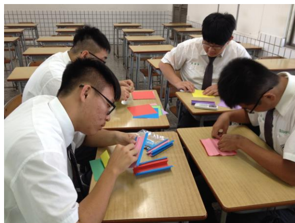
摺紙教學-鏤空正六面體