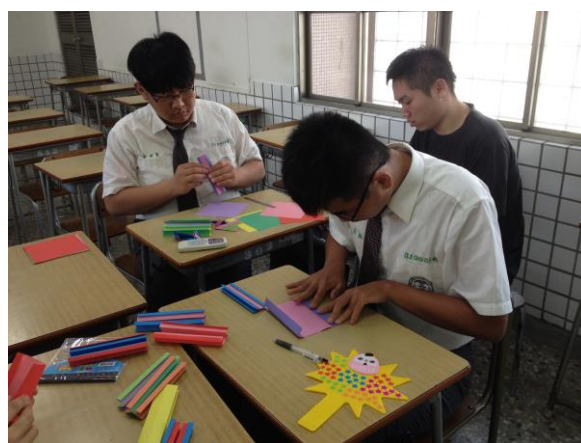
摺紙教學-鏤空正六面體