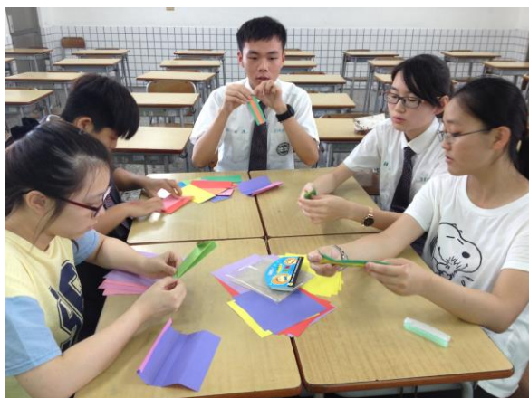
摺紙教學-鏤空正六面體