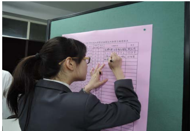
(學生提出符合學測檢定標準之單一學系名稱)