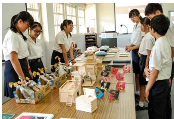
(國中一 A 同學的作品展覽)