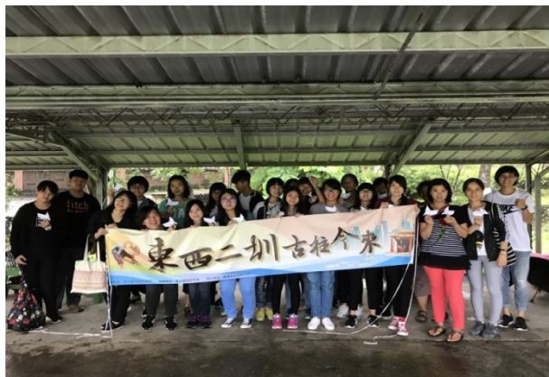
(東西二圳，古往今來團體大合照)

本校師生於6月18日參與彰化縣環保局辦理106年「親子共學，環教遊學趣」環境教育系列活動，希望透過社區參訪，積極培養環境教育知能，提升愛護地球的行動力，進而善待自然環境，減少對環境的破壞。本活動是以「彰化縣灌溉用水命脈—東西二圳」為主軸，了解「東西二圳」的樣貌及周邊生態宣導水污染防治及水資源重要性，另搭配人文導覽之旅，亦透過生態人文導覽深入了解東西二圳古往今來、歷史人文，藉此活動親近環境、走訪體驗，學習人與自然共處的智慧。