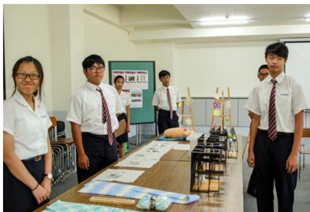
(國中二 A 同學的作品展覽)

國中階段的學習必須創造特色，以因應招生的需求。國中部學生人數少，但每一位學生各有專長與興趣，配合學科知識的導引，相信假以時日，應該會有不同的成就，校長與老師們正引頸企盼中！