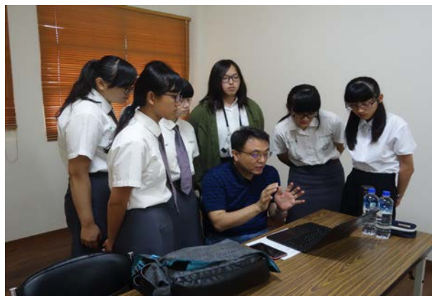
(教授指導面試技巧)