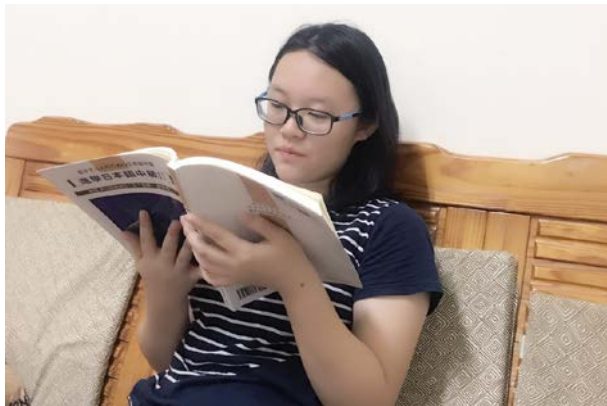
(設定目標，認真準備)