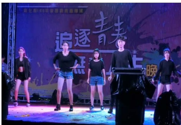
(不畏風雨，青春活力演出)

迎接暑假來臨，並呼籲青年學子一起反毒、反黑、反霸凌，彰化縣政府於6月30日晚間，在員林公園舉辦「追逐青春—無毒人生」晚會。本校計22位學生參與此次表演，儘管當晚遇上大雨，仍未澆息本校學生的參賽熱情。此次表演主題為「毒劇魅影」，劇中描述富二代因好奇夜店世界而意外染毒，但透過朋友的幫助，遠離了毒害，強調「追求無毒的人生，在青春歲月裡面絕不留下遺憾」。活動表演可圈可點，盡全力表現出最好的一面，演出的精神值得稱讚。