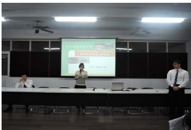
(教務處註冊組說明登記流程)