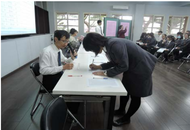
(學生登記大學學群)