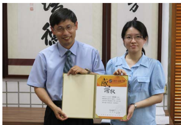
(校長頒發 CWT 全民中檢感謝狀)