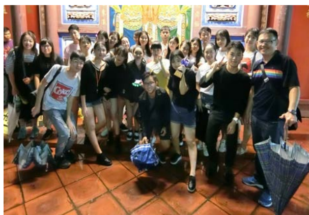
(帶隊教官與參賽同學合影)