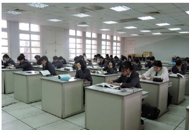
(丙級檢定試題演練，全力以赴)

人生要你彎彎曲曲走些岔路，必定有它的道理存在，就看各位能否在這美麗的錯誤中發現最不平凡的人與風景，創造最豐富的一頁。