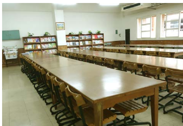
(圖書館閱覽室一景)