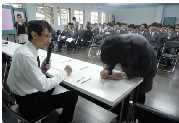
(工作人員唱名及登記學生報到)