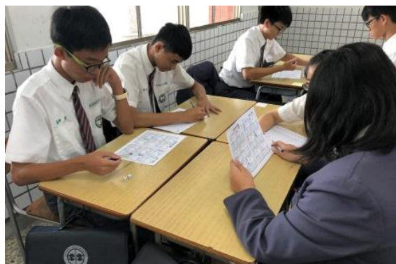
(從桌遊體驗學習數學的樂趣)

數學科教師群與彰化師範大學教授進行共同觀課、議課並積極參與桌遊融入課程研習，初步於高三下學期課程及社團課程規劃融入桌遊，期望於新課綱實施時能夠帶給學生更多元的邏輯推理與溝通能力。