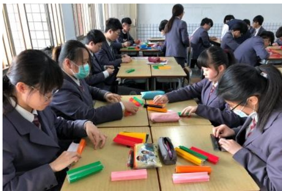
(玩樂中學習，體驗數學的樂趣)