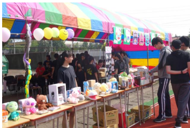
(商營二忠愛心義賣)