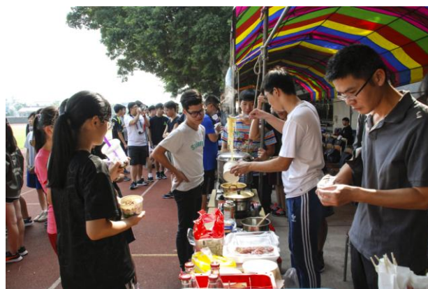
(師生一同準備美食販賣)