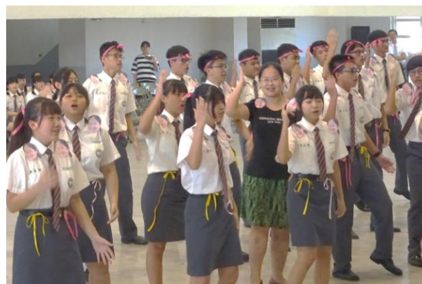
(師生一同參與英文歌唱表演)

在經過一年級的校歌比賽體驗後，今年升為二年級的班級，對於英文歌曲合唱比賽的規畫與準備，可說是更加用心與熱情。在比賽的過程中，有的班級引吭高歌，有的班級勁裝熱舞，更有的班級將老師們的特色照片加裝在身上，並與導師一同參與演出，呈現出多元繽紛的表演風格。藉由這次的英文歌唱比賽活動，不僅可以讓學生學習英文，了解英文歌曲的趣味，培養班級團隊合作默契，更可以激發學生的演出創意與國際觀！