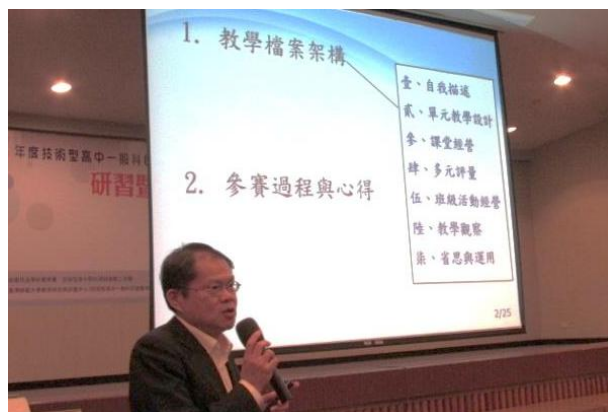
(黃主任得到特優獎時的發表感言)