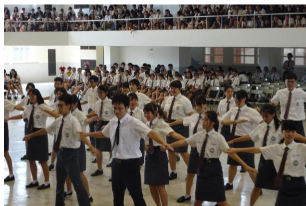
(師生一同參與校歌比賽)