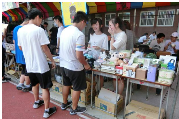
(高中三忠愛心義賣)