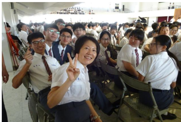
(師生一同參與校歌比賽)

一年一度受到萬眾期待的一年級新生校歌比賽，如期地在 10 月 19 日順利舉行。這回的各班校歌表演內容與眾不同，各具特色。有的著重音量磅薄氣勢，有的著重舞蹈多采多姿，有的著重服裝炫麗耀眼。然而，最特別的是著重親師合作，共同參與的表演內容！因此，這回得獎的班級，大多也是由班級導師與學生一起規畫、練習與表演的班級。由此活動展現出親師之間的良好教學互動與團隊溝通，讓正學培德的校風精神得以更適切的融入在校歌比賽中！