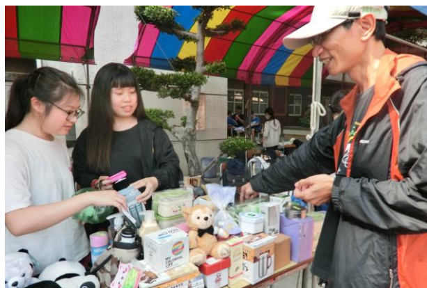
(高中三忠愛心義賣)