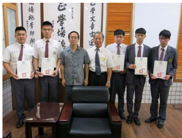
「Arduino 機械手臂」團隊獲獎學生與指導老師合影