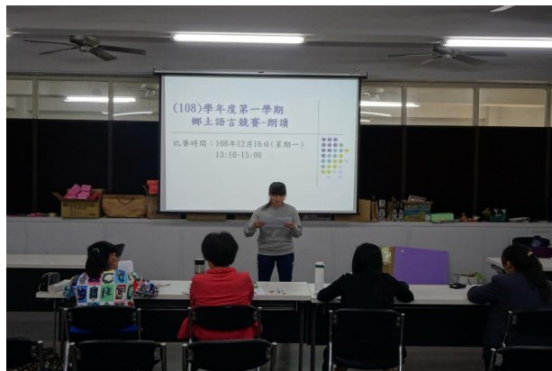
(應日一忠參賽同學專注朗讀、力求表現)