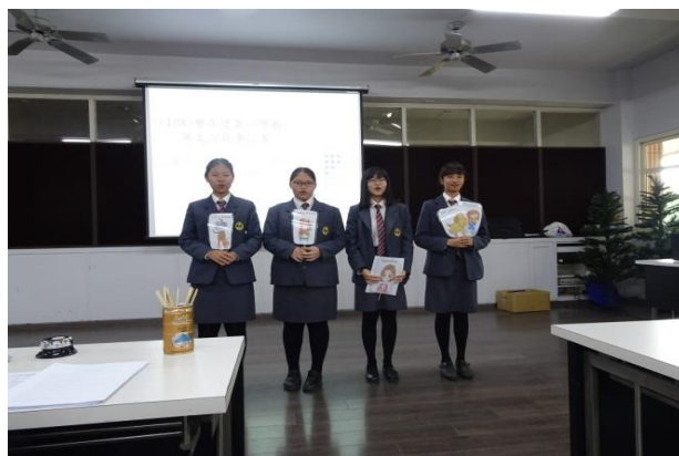
(應英二忠同學道具製作用心)

(108)學年度第一學期英文說故事比賽在12月3日舉行，為了提高學生學習英語的興趣，增進英語口說、演示與創作能力，特舉辦此競賽。參加對象為普通科及應英科一、二年級的同學，本次競賽非常踴躍，共有13組同學參加。參賽學生無不使出渾身解數，呈現最精彩的一面。