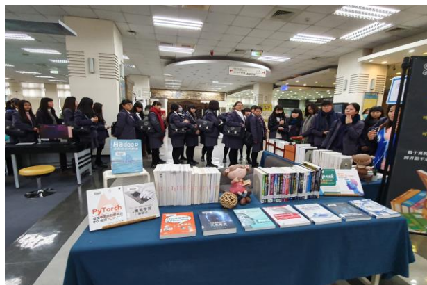
(參觀朝陽科大圖書館)

輔導室為協助高三學生了解大學校園環境以及各類組相關科系的學程及特性，故於 12 月 6 日舉辦大學校系參訪。上午參訪朝陽科技大學，介紹會計系、行銷系、應英系、銀管系，下午參訪亞洲大學，介紹資工系、生醫系、休憩系。透過大學教授的仔細介紹及學長姐的熱心帶領，讓學生對各科系能有進一步的認識，受益匪淺。