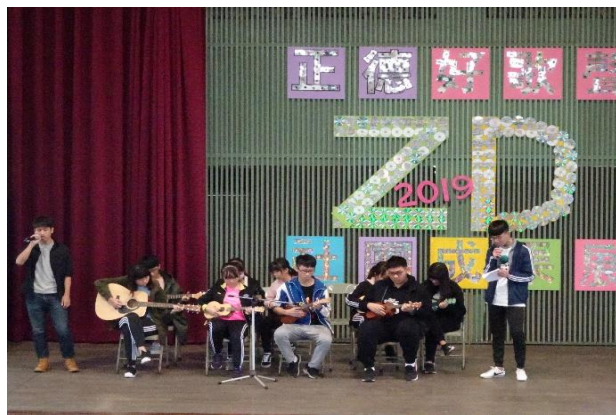
(烏克蘭麗、吉他社展現社團練習的成果)