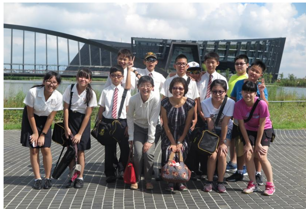
(國中部學生參訪國立故宮博物院南部院區)

(106)學年度國中部暑期學習活動自8月14日起為期三天，活動內容不但讓國中部學生認識本校，亦帶領學生參訪國立故宮博物院南部院區。活動課程涵括藝術、人文、生活科技等領域，以統整性課程提升學生對各領域的興趣，並培養其實作能力，成果卓著。