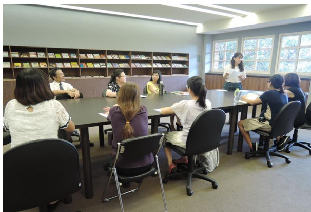
(英文科期初教學研究會)