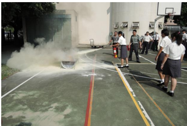
(新生防震防災消防演練)

本校於 8 月 28、29 日舉辦為期兩天的新生預備教育訓練，活動內容包含校園導覽、校歌教唱、服儀示範、心肺復甦術教授與演練、防震防災消防演練及各處室業務工作報告等。其中教務主任以「態度決定高度」為主題，藉由學生熟知的歌手盧廣仲與周子瑜他們兩位的成功故事勉勵所有新生，應把握時間努力學習，以創造自己璀璨亮麗的未來。