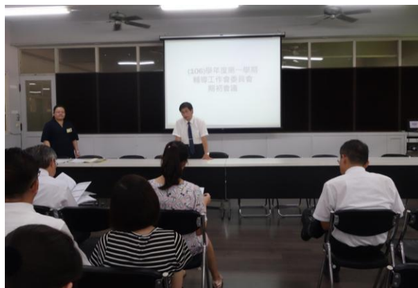
(輔導室召開例行法定會議)

輔導室召開的例行法定會議包含輔導工作委員會、特殊教育推行委員會、家庭教育委員會、生涯發展教育會議、性別平等教育委員會、學生申訴評議委員會、身心障礙學生暨特教學生個別化教育計畫會議等。這些法定會議每學期至少固定召開一次，主要目的都是為了能順利推行與學生輔導相關之業務。