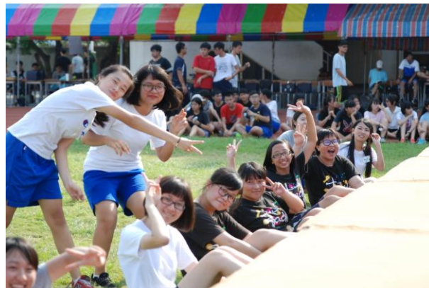
（青少年生活應該是充滿青春亮麗色彩的）