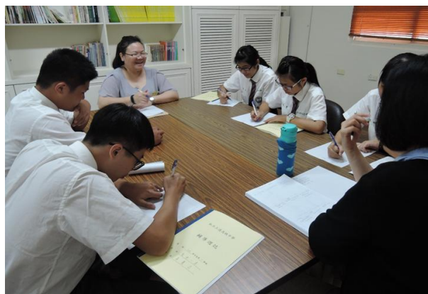
(輔導主任說明輔導股長之職責)

班級幹部訓練活動中，校長期許新任幹部能磨練自我、努力學習，接著學務主任期勉各班幹部要以高標準自我要求，從而成為同學們的模範，隨後，各處室主任分別說明幹部工作職責內容，以期使各班幹部在任事時能有所依循，進而能勝任各項職務。此外，本學年度班級幹部增列輔導股長一職，該職為輔導室與班級同學的橋樑，協助輔導教師推展班級輔導並鼓勵同學多與教師溝通。