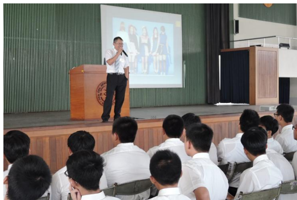
(教務處業務工作報告)