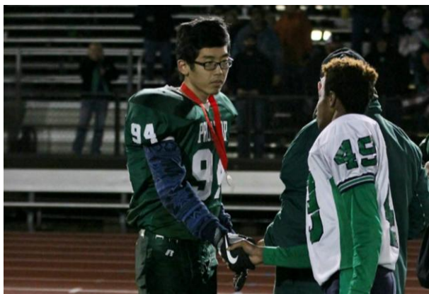
(參加美國學校橄欖球隊)

在我剛到紐約的時候發生了一個小插曲，出發前交換機構的人一直跟我們說不用擔心，雖然剛開始語言不通，但下飛機時就會有人來接機。結果，我出關時沒看到半個人，我心裡想他們可能遲到了，但等了 20 分鐘後還是沒有人來找我，於是我就跑去問一個警察，交換生要在哪裡集合？結果那個警察跟我說不知道，又過了 20 分鐘後看到兩個大陸人剛下飛機，我跟他們借手機打給交換機構，好不容易打通後又是一道難題，這個緊急專線是全英文的，我和他們雞同鴨講了很久，最後是那兩個大陸人出手幫我說明狀況，然後就有人來接我了。最後我才知道交換機構的人和其他交換學生都是在國際機場的出境大廳，而我因為是在舊金山轉機，抵達的是國內線的大廳，難怪沒人接機，想起當時那種緊張的心情，真的令我餘悸猶存。