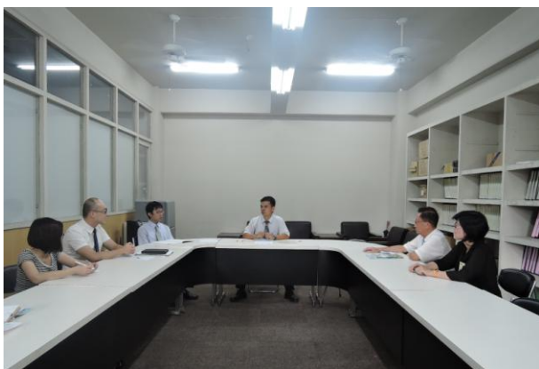
(數學科期初教學研究會)

教務處於開學前召開期初教學研究會，以期提升學生學習成效，增進教師專業發展。研議的主題包含教學進度之擬定、定期評量之命題範圍以及學生作業之相關規定。另外，尚規劃教師專業成長共同研習課程與修訂本學期各學科競賽辦法，最後，以各科任課教師班級管理及有效教學的經驗分享畫下句點。