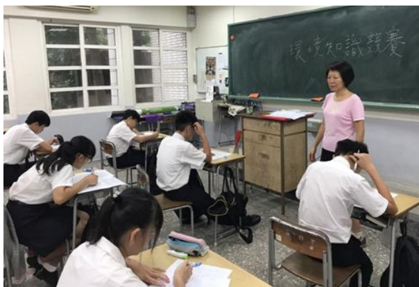
(國中二 A 同學參賽情形)