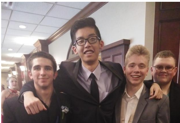
(與外國友人一同參加舞會)