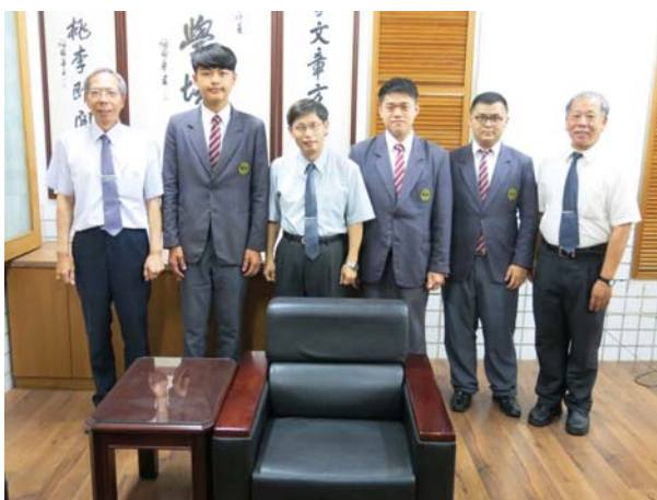
通過繁星計畫順利考上著名科技大學的三位同學與校長、導師合影