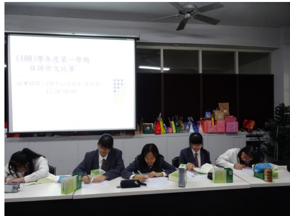
參賽對象為應日科二、三年級學生