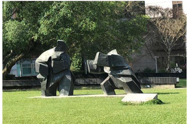
(圖 1)中央研究院學術活動中心前面草坪上

每次走進台北中研院，一幅巨大石雕作品總會吸引我的目光(圖1)。經由同學的介紹，方才了解這一公共藝術原來是著名雕塑家朱銘的「太極」系列作品。在中研院學術聖堂的廣場上，擺上這一作品別有深意。至少對於我來講，學術研究，特別是文史等研究，真的需要深厚的功力，就如同太極拳含蓄內斂、連綿不斷的拳法。所以每次到中研院台史所時，我總以此一作品自我勉勵，期許能夠善用人生的最後歲月，體驗並能夠優游於社會及人文學科知識的奧秘中！