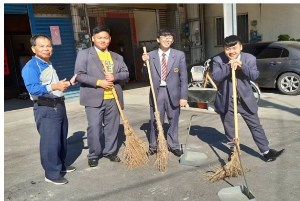
(與荊桐里里長合照)