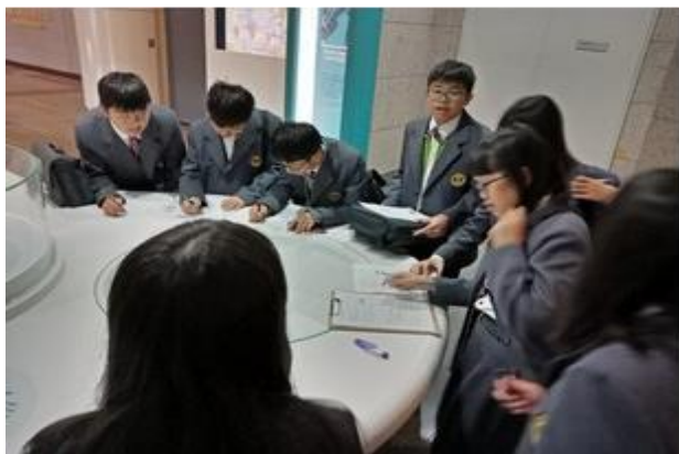
(「郝遊半線」校外踏查小組討論)

所有學科之設計，扣合著本校之發展重點，培育學生語言表達能力、展現學生無限之創造力與做中學之實作能力，最後引導學生將學習成果應用在生活中，並思考解決問題該有之態度與方法。