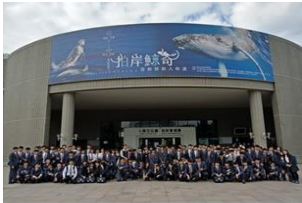
(「郝遊半線」校外踏查合照)