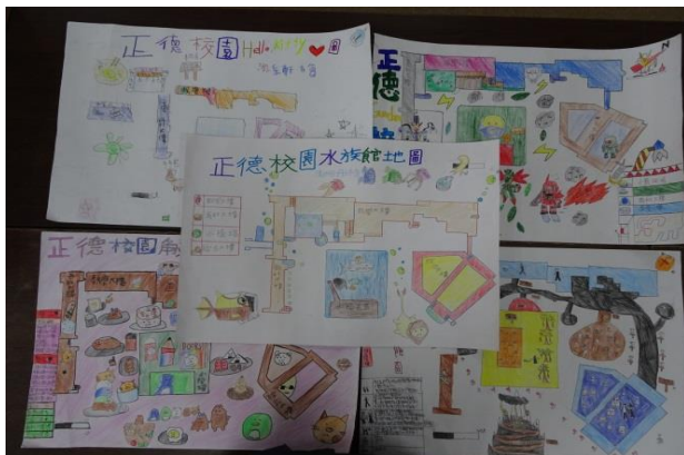
(國中一 A 學生精彩作品)