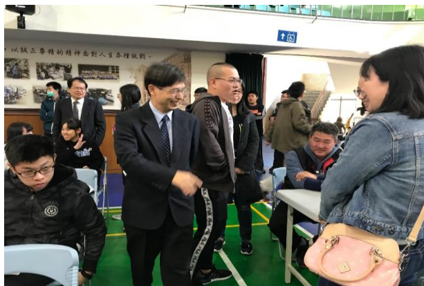
(校長赴學測考場幫同學加油)

(109)學年度學科能力測驗於1月17、18日舉行，學校依循傳統，由校長帶領教務主任、學務主任及輔導主任到考場為考生加油打氣。同學們在認真學習二年半後，終於要在學測中展現實力，也期待有優秀的成績表現。這二天的考試中，同學們在導師的陪伴之下，得到必要的協助，減少在陌生環境的不安。