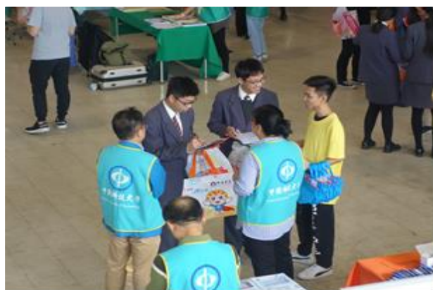
(校系漫遊活動概況)