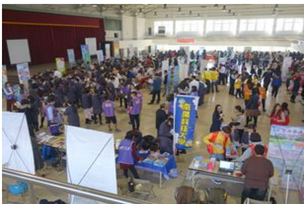
(校系漫遊活動概況)

輔導室為協助高三學生瞭解大專院校校系特色及升學管道，選擇適性升學進路，於1月3日舉辦大專院校校系漫遊活動，共有46所大專院校參加，透過各大專院校教授親臨現場解說，讓學生對於各種入學管道以及各科系的進路發展，能有進一步的了解，以求多元適性發展。