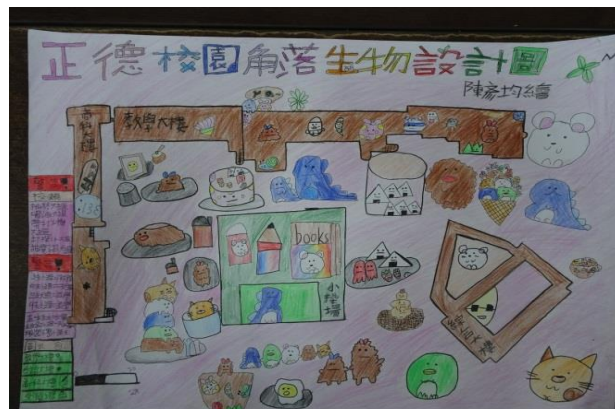
(國中一 A 陳彥均得獎作品)