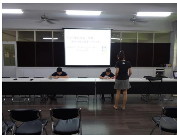
監考教師與全體參賽學生