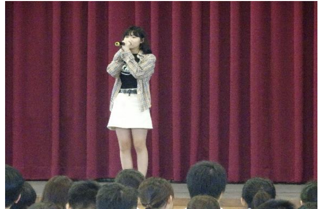
(二年級同學歌唱表演)