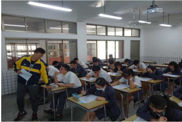
(同學相當踴躍，爭取班級榮譽)