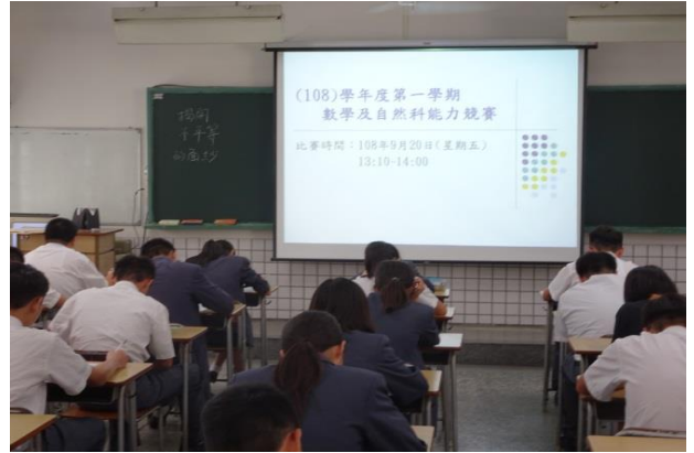
(參賽同學專心作答)