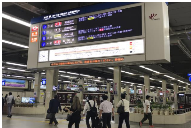
(搞清楚複雜的日本地鐵「電車網」，是在日本生活的第一步)

短期進修學習是我這一次出國的主要目的，然而伴隨學習所產生的日本人平時生活的觀察與體驗才是最大的收穫。我住宿地點在大阪吹田市