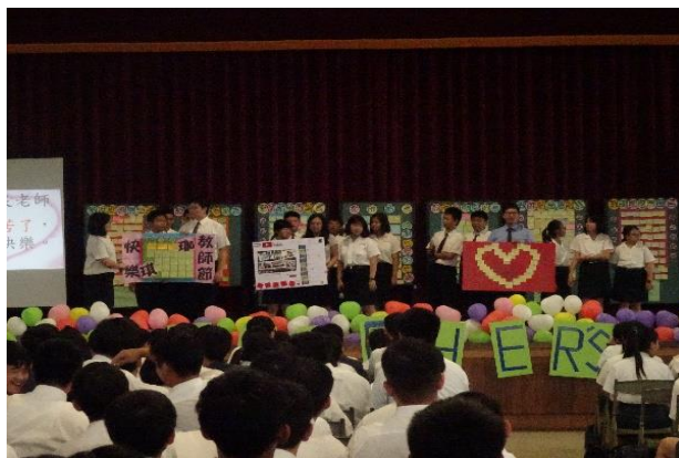
(國中部同學致贈卡片)

為了讓同學感謝老師們教學的辛苦，本校利用班會時間舉辦本年度教師節感恩活動。此活動主要有三個重心，第一是「猜猜我是誰」，螢幕上秀出老師們的年輕相片，請同學們用力猜猜看。第二部分是表演活動，請全校的師生一起欣賞同學們精彩的歌唱及跳舞的表演。第三部分是各班上台致贈卡片，並大聲地說出感謝老師的一段內心話。就在充滿歡樂及溫馨的氣氛下，師生們共同度過別出心裁的教師節活動。