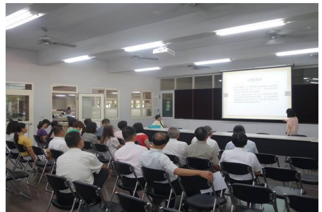
(輔導工作委員會期初會議)

8 月 29 日開學日，輔導室為了完整推動各項輔導工作，於當日召開各種相關會議，如輔導工作委員會、特殊教育推動委員會、學生申訴評議委員會、生涯發展委員會，以及家庭教育工作委員會等。於各項會議中排定各相關工作時程，並向所有委員報告輔導室的工作業務，期許全體同仁共同支持新年度的輔導工作。