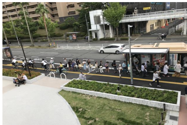
(排隊上下公車是日本常見的景象)

這次初步對日本文化的體驗雖然很表象，但也引發我不少反思。我感覺日本人似乎受到社會團體很大的約束，但在一生努力追求工作成就的過程中，依然保有自己孤獨的身影，靜靜地享受生活上美的事物，不管是釣魚、賞楓或閱讀、泡澡。日本文化強調群體，個人無法脫離團體，但認同團體紀律的生活中，亦保留自己追求知識、享受美感藝術的個人權利，這是校長對此次日本行的最大感想。