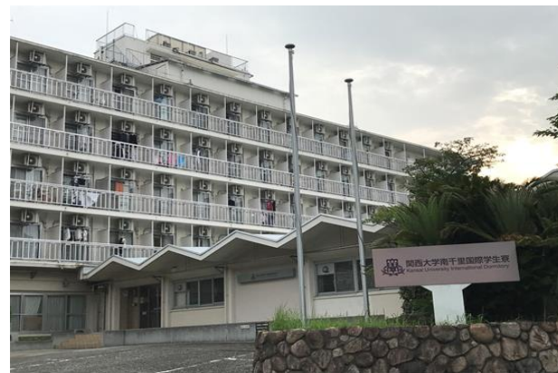
(關西大學國際學生宿舍)