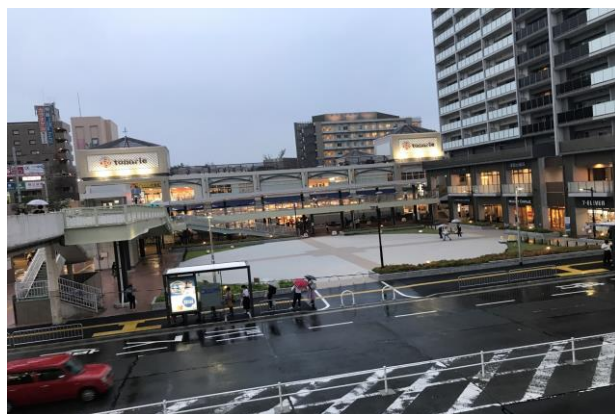
(南千里車站附近商場)