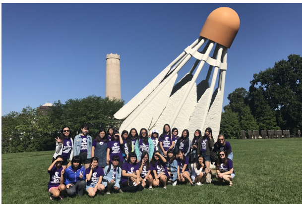
(參加美國杜魯門州立大學安排的課後活動)

本年度的海外暑期語言研習活動圓滿結束，三個營隊共計 66 位同學分赴美國杜魯門州立大學、日本磐田東高等學校與京都學園大學參與暑期英、日語文學習體驗活動。每一營隊的海外活動時間為期四週，且由當地大學生帶領同學進行課程學習，假日或課餘時間順道參訪各地景點，參加的同學們都感覺這是一趟開拓眼界、體驗異國文化的學習之旅。