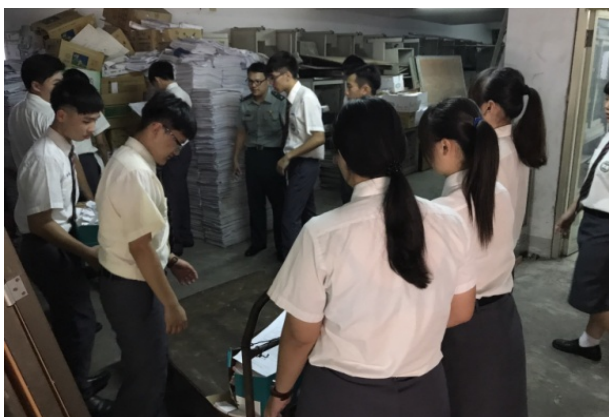
(教官與同學協助清運物品)