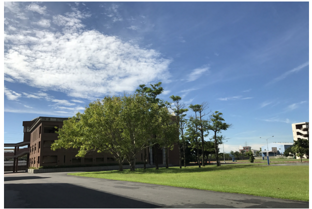
(校園一隅，寧靜而優美)

個美好的體驗。(106)學年度本校招生科別有普通科、電子科、商業經營科、應用外語科英文組及應用外語科日文組，免試入學之招生名額全部額滿。報到當日假本校禮堂辦理，服務學生來回奔走、揮汗如雨，每一位皆展現他們的專業與熱情，禮貌的招呼、細心的指引前來的新生與家長們。禮堂一角，新生排隊報到、量製服裝、領取註冊程序單…等，可見報到的情形相當踴躍，隨著時間的流逝，終於順利且圓滿的結束本次新生報到。本校師生同仁熱烈的歡迎每一位新生成為正德的一份子！