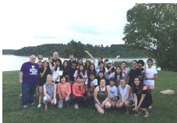
(獲邀參與美國人家庭的野餐活動)