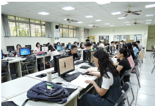
(動手做 Line 貼圖現場，教師們聚精會神地學習創作)

暑假兩場次的研習讓教師的行程滿滿，在放假之餘亦能充實專業知識，迎接下個學期的挑戰。