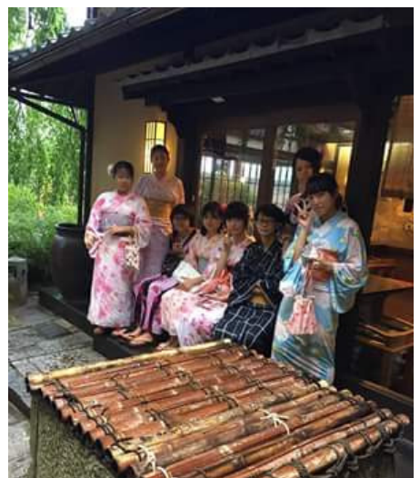
(穿上和服，體驗當地文化)

記得第一次到龜岡時，真的覺得跟東京比起來鄉下許多，一開始還覺得有些麻煩，但生活久了就漸漸習慣那裡的一切。而第二次到龜岡，感覺就像回到自己的家鄉一樣，熟悉的道路、