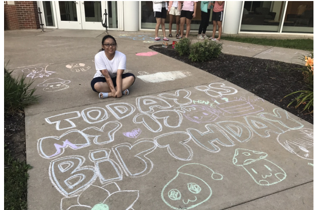
(課後活動體驗—地板彩繪作品)

我覺得在美國種種的體驗都是新奇且有趣，從一開始不敢在麥當勞點餐，到離開前，我已經可以從容不迫地向店員點餐，我不再害怕講英文。除此之外，也能很自然地與當地的人互動，這在台灣是很難見到的，包括去訪問陌生人。在台灣我很少主動跟他人交談，更不會因為見過一次面後就熟絡起來，下次見面頂多就是點個頭罷了。可是在美國卻完全不同，那裏的人們總是容易地對新認識的朋友敞開心胸。而離開美國前的舞會是我們最後能夠跟當地人相處的時間，在舞會裡，我的心情因離別而感到沉重，我會永遠記得他們。