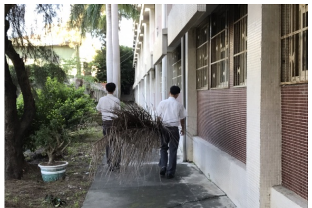
(同學清理大型落葉)