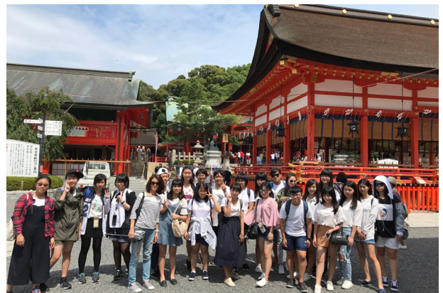
(參加日本京都學園大學暑期語言研習師生於日本神社前合影)