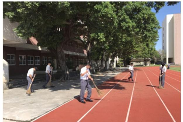
(同學齊心打掃校園)