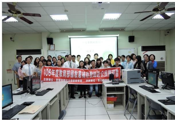
(第一梯次研習，全體教師大合照)