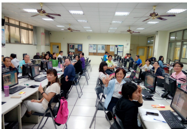
(輕鬆熱情的研習氛圍，教師們獲益良多)