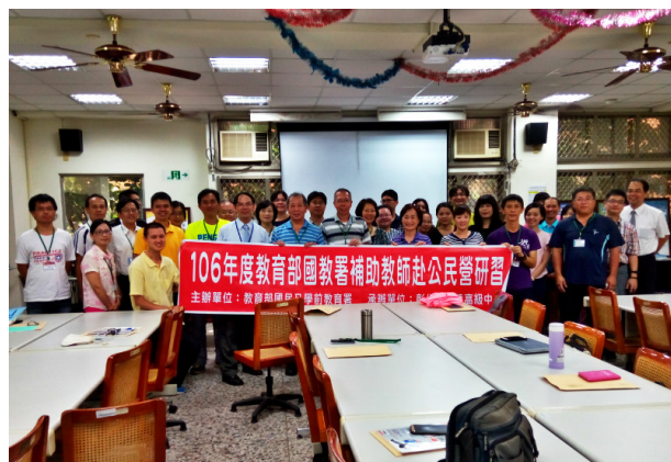
(第二梯次研習，全體教師大合照)