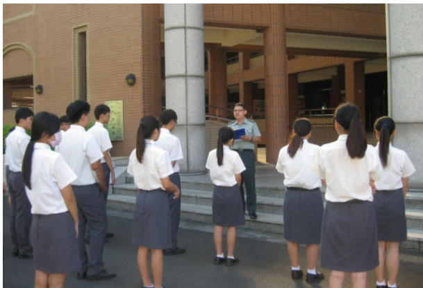
(當日實施愛校服務點名)

今(106)年度暑假於 7 月 12 日起辦理愛校服務，兩天共計三場次，合計 85 位同學參加。透過愛校服務的方式啟發學生學習自動自發、對自己行為負責的精神，亦讓校園更加乾淨及美麗，藉此鼓勵並輔導已觸犯校規之學生能及時改過、重新奮發向上，建立正確的價值觀。